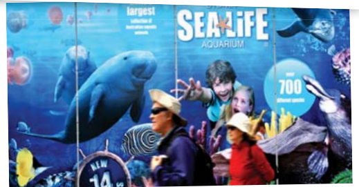
豐富多彩的悉尼活動任君選擇