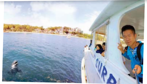
在史提芬港邂逅野生海豚